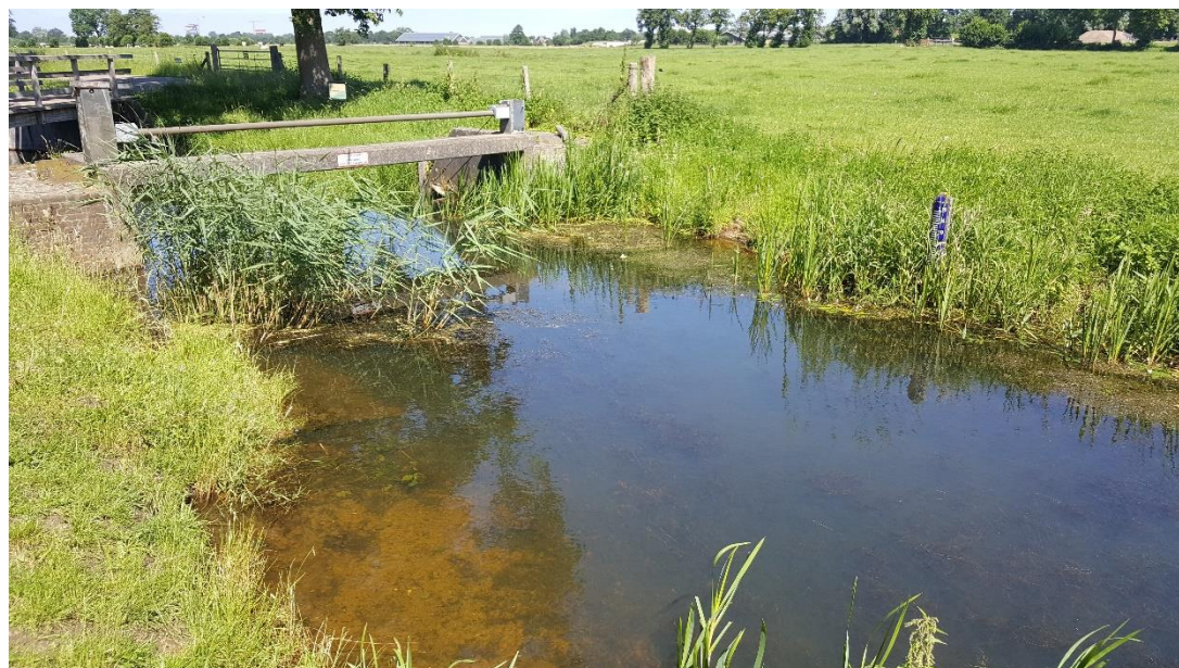
Figuur 3: Foto locatie tijdens veldbezoek op 27 juni 2019.