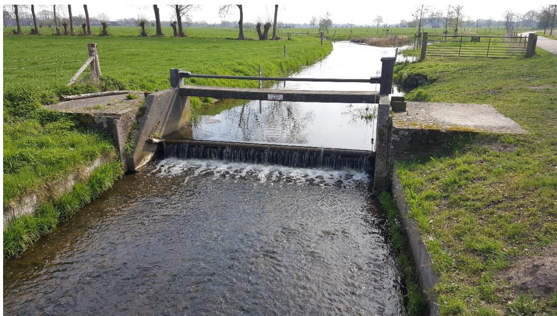
Figuur 2: Foto locatie tijdens veldbezoek op 9 april 2019.