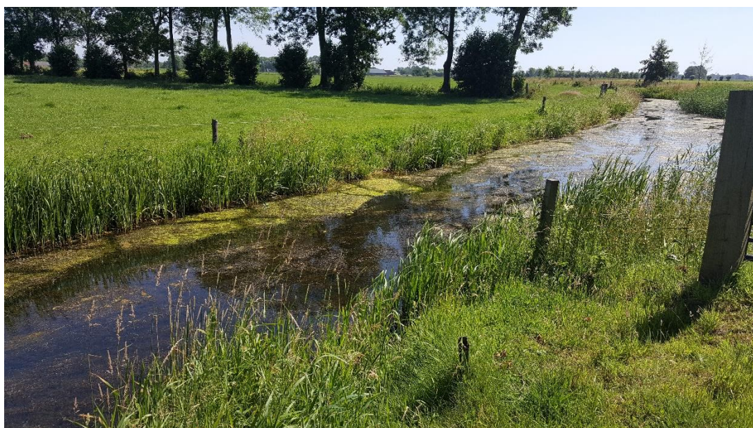
Figuur 5: Foto locatie tijdens veldbezoek op 27 juni 2019.