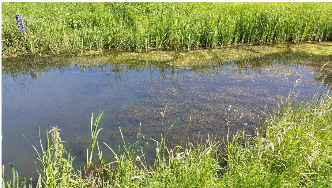
Figuur 4: Foto locatie tijdens veldbezoek op 27 juni 2019.